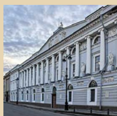
Российская национальная библиотека