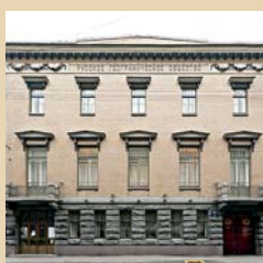
Русское географическое общество