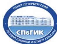
ФГБОУ высшего образования «Санкт-Петербургский государ- ственный институт культуры»