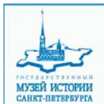
СПб ГБУК «Государственный музей истории Санкт-Петербурга».